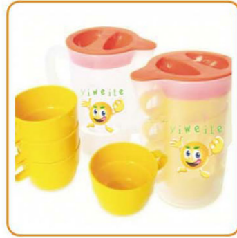
■ YWT-7050 名称: 杯子 材料: 身PP 尺寸: L115×W95×H167mm 箱规: 60×40×53.5cm