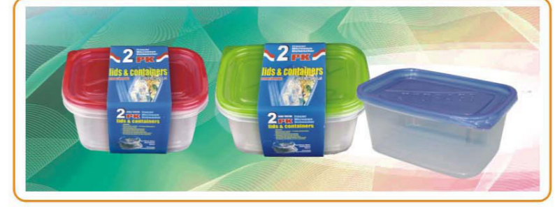
ARTNO.:YWT-1124-red cover/1124-green cover/1124-64oz