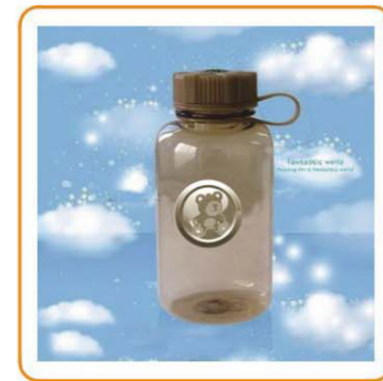
YWT-2862 名称: PC水壶 尺寸: D80×H175mm 容量: 650ml 箱规: 52.5×35.5×38.5cm 毛重: 7kg 净重: 6kg