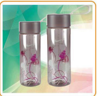
ART NO.:YWT-2835/2836 Material:PC Size:7.5x19.5cm/7.5x22cm Packing:0.082cbm/72pcs 0.063cbm/48pcs Unit Packing:Opp Bag