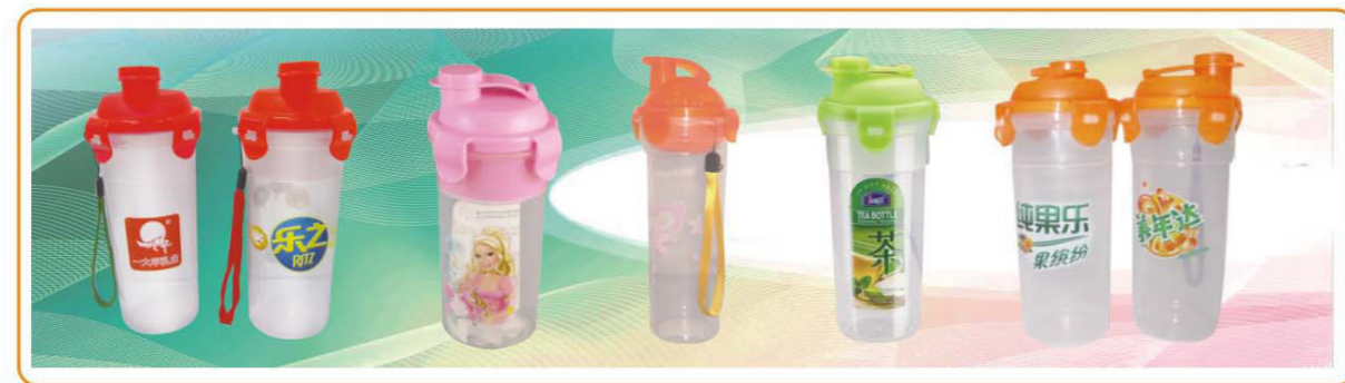
■ YWT-2493/2494/2495 名称: 便携水杯 容量: 350ml/450ml/650ml