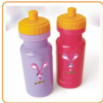
YWT-2594 名称: 运动水壶 尺寸: D72×H208mm 容量: 500ml 箱规: 60×38×45cm 毛重: 5.2kg 净重: 4.48kg