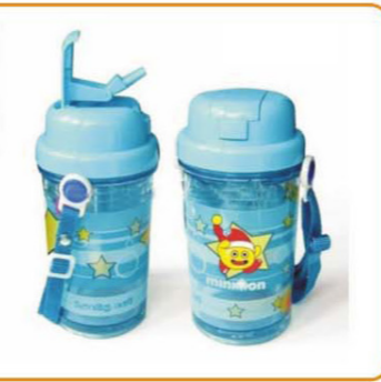
YWT-2868 名称: 儿童水壶 尺寸: D70×H161mm 容量: 300ml 箱规: 49×37×55.5cm 体积: 0.101cbm