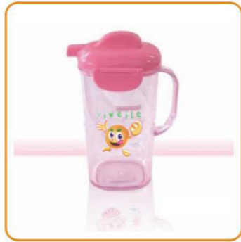
YWT-7004 名称: 多用水壶 尺寸: L137×W107×H206mm 容量: 1000ml