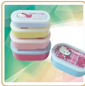
■ YWT-6453 名称: 饭盒 材质: PP 规格: 14.5×8.5×5.5cm 外箱尺寸: 57.5×51.5×40.5cm 装箱率: 160pcs