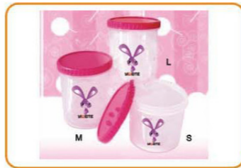
ART NO.:YWT-3917/3918/3919 STORAGE CONTAINER Size:11x12.1cm/11x15.3cm/11x23.2cm Packing:0.116cbm/72pcs 0.117cbm/60pcs 0.117cbm/40pcs