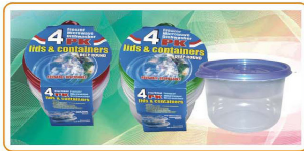
ARTNO.:YWT-1122-red cover/1122-green cover/1122-31oz