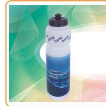
YWT-2595 材质:PE 尺寸:7×22.5cm 容量:700ml 装箱率:100pcs 箱规:72×72×24.5cm