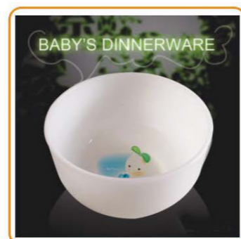
YWT-6513 名称: 儿童饭盒