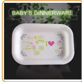
YWT-6509 名称: 儿童饭盒