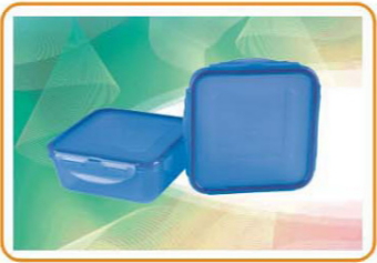
ART NO.:YWT-3968 Size:15.5x15.5x6.3cm Packing:0.11cbm/64pcs