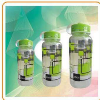
■ ARTNO.:YWT-2789S/M/L SPORTS BOTTLE Capacity:600ml 800ml 1000ml Size: 8.2×5×17cm 8.5×5×19cm 8.5×6×20cm Packing:0.098cbm/72pcs 0.084cbm/48pcs 0.104cbm/48pcs