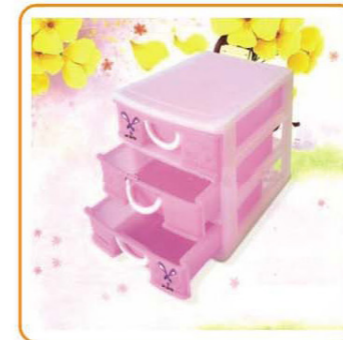
YWT-4201 名称: 储物盒 尺寸: L180×W135×H160mm 箱规: 58.5×28×65cm