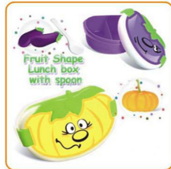
■ YWT-6456 名称: 饭盒 尺寸: L180×W127×H75mm 箱规: 56.5×50×65cm