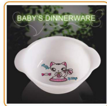
YWT-6510 名称: 儿童饭盒