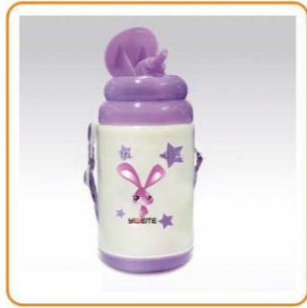
YWT-2871 名称: 保温水壶