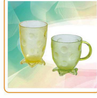
ART NO.:YWT-2252 YWT-2251 CUP Size:8x11.5cm 8.2x9.2cm Packing:0.088cbm/126pcs 0.101cbm/168pcs