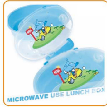
■ YWT-6304 名称: 微波炉饭盒 尺寸: L190×W130×H55mm 箱规: 59.5×41.5×53.5cm