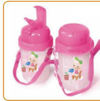
YWT-2866 名称: 儿童水壶 尺寸: D87×H160mm 容量: 500ml 箱规: 56×48×70cm 体积: 0.188cbm 毛重: 15kg 净重: 13kg