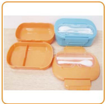
■ YWT-6451 名称: 饭盒