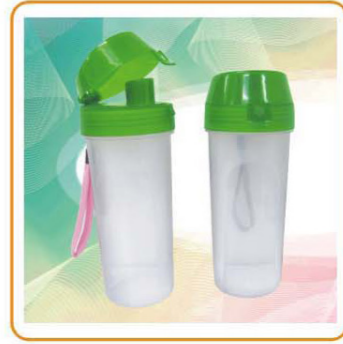
■ YWT-2433 材质: PP 尺寸: 6.5×19.5cm 容量: 350ml 装箱率: 120pcs 箱规: 58×38×58cm