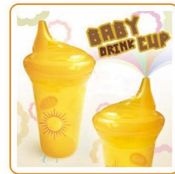
■ YWT-2579 名称: 婴儿杯 尺寸: D75×H159mm 容量: 250ml 箱规: 48.3×32.5×55.3cm 毛重: 5.17kg 净重: 3.67kg