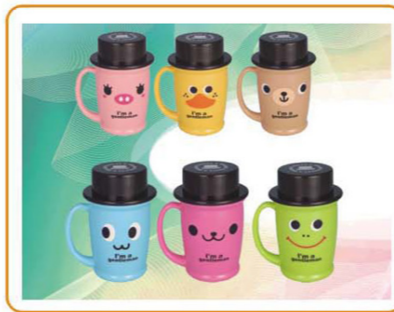
YWT-2331S/L2459-1 尺寸: 8×11cm 体积: 0.127cbm 容量: 120pcs