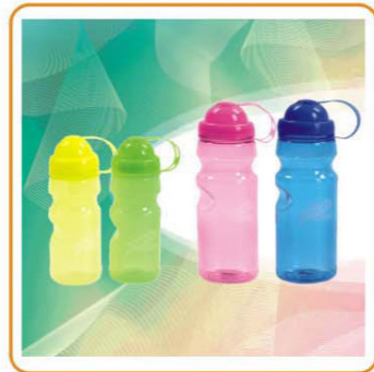
■ ART NO.:YWT-2721/2721-A/2722/2722-A SPORTS BOTTLE Capacity:500ml/700ml Size:20x7.5cm/24.5x7.5cm Packing:0.082cbm/72pcs 0.110cbm/72pcs