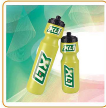
■ ART NO.:YWT-2636L/2635S Material:PE Size:7×31.5cm/7×14cm Packing:0.116cbm/80pcs 0.117cbm/112pcs Unit Packing:Opp Bag