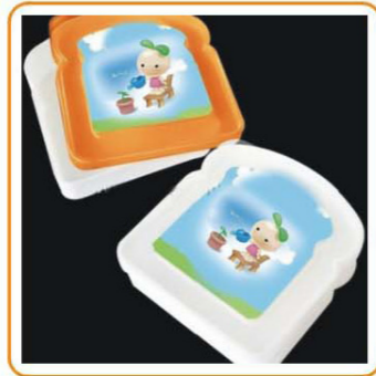
■ YWT-6384 名称: 饭盒 材料: 盖PS 身PP 尺寸: L130×W125×H40mm 箱规: 52×62.5×36cm