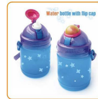
YWT-2872 名称: 弹盖水壶 尺寸: D90×H155mm 容量: 600ml 箱规: 58×39×35cm 毛重: 8.8kg