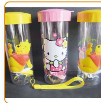
■ YWT-2619PS 名称: 水壶 尺寸: L7.5×H16.5mm 体积: 0.10cbm 箱规: 55×35×53.5cm 装箱率: 120pcs