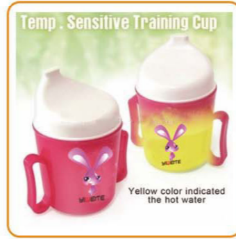
■ YWT-2576 名称: 感温容器 尺寸: D97×H113mm 体积: 0.08cbm 箱规: 45.5×38×48.5cm 毛重: 7kg 净重: 6kg