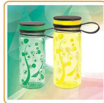
ART NO.:YWT-2844/2845 Material:PC Size:19.5x7cm/23x7cm Packing:0.082cbm/72pcs 0.063cbm/48pcs Unit Packing:Opp Bag