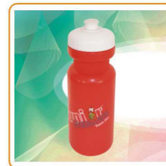
YWT-2599 材质:PE 尺寸:7.2×20.3cm 容量:500ml 装箱率:100pcs 箱规:74×38×43cm