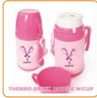
YWT-2869 名称: 保温水壶 尺寸: D90×H104mm 容量: 500ml 箱规: 76×42×59.5cm 体积: 0.19cbm