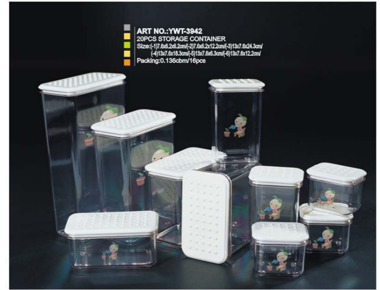
ART NO.:YWT-3942 20PCS STORAGE CONTAINER Size:(-1) 6x6.2x6.2cm(-2) 7.6x6.2x12.2cm(-3) 13x7.6x24.3cm (-4) 13x7.6x18.3cm(-5) 13x7.6x6.3cm(-6) 13x7.6x12.2cm Packing:0.136cbm/16pcs