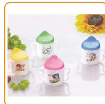
■ YWT-2683 容量: 200ml 装箱率: 280pcs 箱规: 54×36×59cm