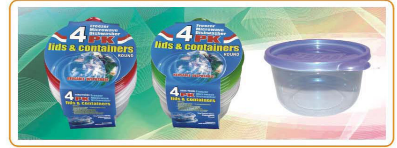
ARTNO.:YWT-1125-red cover/1125-green cover/1125-25oz