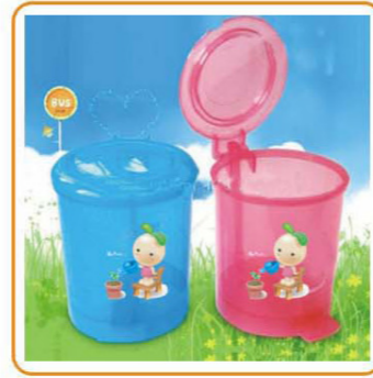
■ YWT-7543 名称: 垃圾桶 尺寸: D130×H166mm 箱规: 81.5×55.5×51.5cm