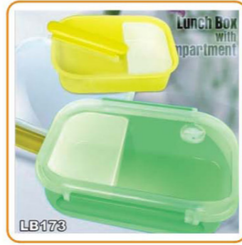
■ YWT-6433 名称: 微波炉饭盒 尺寸: L188×W143×H63mm 箱规: 58×45×58cm