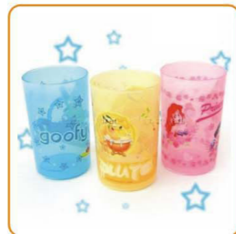
■ YWT-2015 名称: 水杯 尺寸: D55×H102mm 体积: 0.016cbm