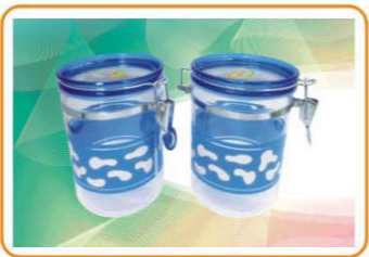
YWT-4003 材质: PS 尺寸: 11×15.5cm 容量: 1050ml 装箱率: 96pcs 箱规: 67.5×46×60.5cm