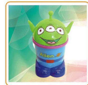
■ YWT-7548 名称: 垃圾桶