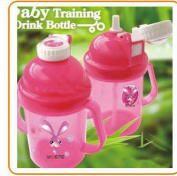
YWT-2577 名称: 婴儿水壶 尺寸: L113×W70×H143mm 容量: 250ml