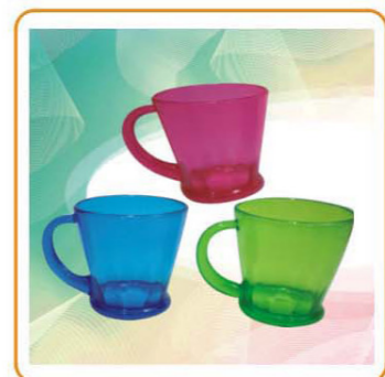
■ ART NO.:YWT-2256 CUP 8 oz Size:8.8x8.3cm Packing:0.125cbm/210pcs