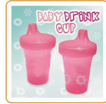
■ YWT-2578 名称: 婴儿杯 尺寸: D75×H132mm 容量: 240ml 箱规: 81.8×79.3×73.3cm 毛重: 13.88kg 净重: 12.38kg