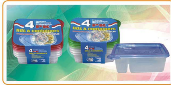
ARTNO.:YWT-2528-red cover/2528-green cover/2528-25oz