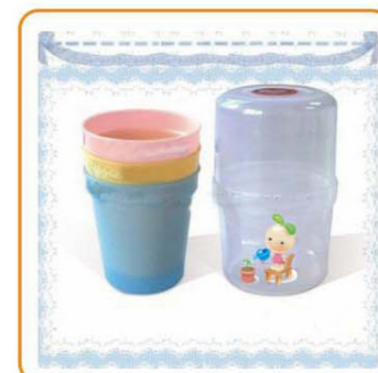
■ YWT-2535 名称: 水杯 尺寸: D75×H120mm 装箱率: 120套 箱规: 68×51×70cm 毛重: 13kg 净重: 11.5kg