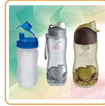
■ YWT-2492S/2492M/2492L 容量: 350ml/500ml/650ml 体积: 0.106cbm/0.085cbm/0.07cbm 装箱率: 120pcs/72pcs/48pcs