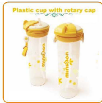
■ YWT-2547 名称: 旋盖杯子 尺寸: D69×H225mm 容量: 500ml 箱规: 52×36×48cm