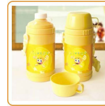
YWT-2656 名称: 保温水壶 尺寸: D90×H191mm 容量: 360ml 箱规: 55×38×54cm 毛重: 10.5kg 净重: 8.5kg