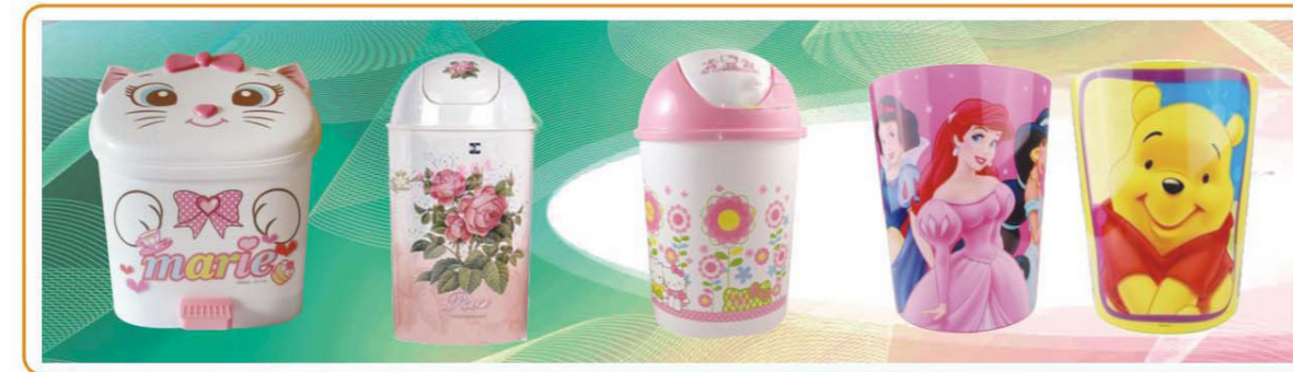
■ YWT-7544 名称: 垃圾桶