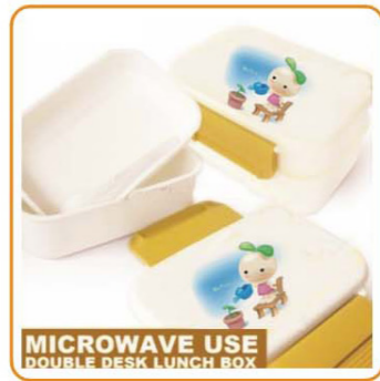
■ YWT-6440 名称: 双层饭盒 尺寸: L180×W135×H87mm 箱规: 73.5×41×66.5cm 毛重: 17.5kg 净重: 15.5kg