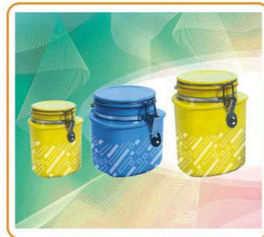
ART NO.:YWT-3911S/M/L STORAGE CONTAINER Size:13x12.6/13x16/13x18.5cm Packing:0.124cbm/60pcs 0.118cbm/45pcs 0.135cbm/45pcs