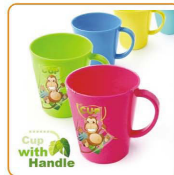
■ YWT-2017 名称: 水杯 尺寸: D80×H94mm 容量: 280ml