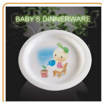
YWT-6514 名称: 儿童饭盒