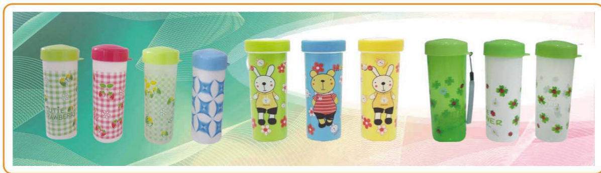
■ YWT-2637S/2638L 名称: 旋盖杯子 容量: 300ml/360ml 尺寸: 68×41.5×46.5/60.5×42×47 装箱率: 144/108pcs