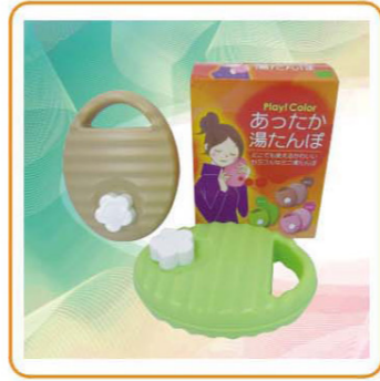
■ YWT-3422 名称: 杯子 材料: PP 容量: 250ml 体积: 0.13cbm 尺寸: L160×W125×H55mm 装箱率: 72pcs