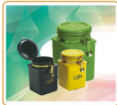
ART NO.:YWT-3956S/3956M/3956L STORAGE CONTAINER Size:11x11x13.4cm(S)/11x11x16.7(M)/11x11x20.5cm(L) Packing:0.134cbm/60pcs(S) 0.131cbm/48pcs(M) 0.161cbm/48pcs(L)