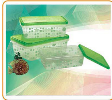
ART NO.:YWT-6315C 3PCS STORAGE CONTAINER SET Size:17x12x6cm(S)/20x14x7cm(M)/22.5x16x8cm(L) Packing:0.14cbm/48sets