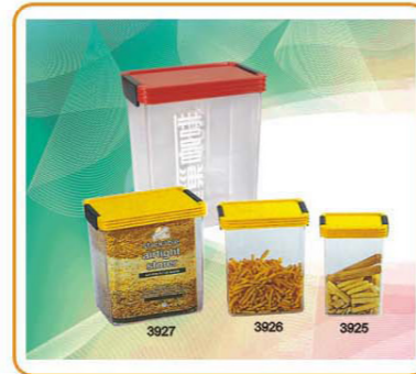
ART NO.:YWT-3925/3926/3927 3PCS STORAGE CONTAINER Size:12.7x8.7x18.5cm(S)/16.7x11.9cm(M)/20x14x22cm(L) Packing:0.109cbm/48pcs(S) 0.098cbm/24pcs(M) 0.119cbm/18pcs(L)