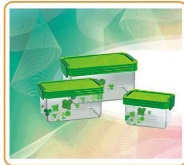
ART NO.:YWT-3924C STORAGE CONTAINER Size:12.7x8.7x7.8cm(S)/16.7x11.9cm(M)/20.8x14x10.8cm(L) Packing:0.079cbm/24sets