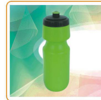
YWT-2600 材质:PE 尺寸:7.2×23.5cm 容量:700ml 装箱率:100pcs 箱规:73.5×37×50cm