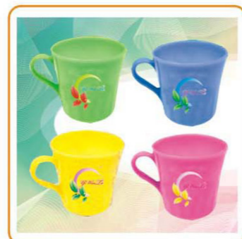
■ YWT-2100 名称: 杯子 尺寸: D83×H88mm 箱规: 64.5×40×58cm 毛重: 13.9kg 净重: 10.7kg