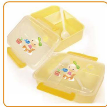
■ YWT-6441 名称: 饭盒 尺寸: L185×W142×H65mm 箱规: 77×45×57cm 毛重: 16kg 净重: 14.8kg