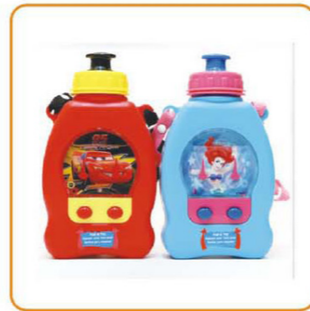
YWT-2622 容量: 420ml 装箱率: 96pcs 体积: 0.11cbm