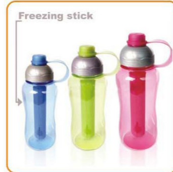
YWT-2809 名称:带冰冻棒的PC水壶 尺寸:D72×H202mm 容量:400ml 箱规:44.5×37.5×42.5cm 毛重:10.5kg 净重:9.2kg