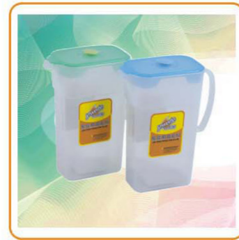
■ ART NO.:YWT-7002 PITCHER Size:17x8x20.5cm Packing:0.138cbm/48pcs