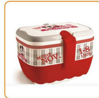
■ YWT-6452 名称: 饭盒