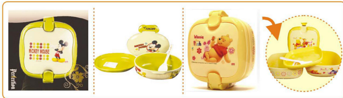
■ YWT-6447 名称: 儿童饭盒