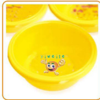
YWT-7225 名称:脸盆 尺寸: D202×H75mm 体积: 0.108cbm