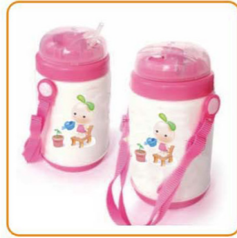
YWT-2870 名称: 保温水壶 尺寸: D85×H162mm 容量: 350ml 箱规: 74.5×39×57.5cm 体积: 0.167cbm 毛重: 19.5kg 净重: 17kg