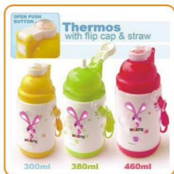
YWT-2878 名称: 保温水壶 尺寸: D90×H230mm 容量: 460ml 箱规: 56×48×47cm