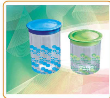
ART NO.:YWT-3960S YWT-3960L STORAGE CONTAINER Size:9.8x11.5cm(S)/9.8x15cm(L) Packing:0.123cbm/96pcs(S) 0.129cbm/72pcs(L)