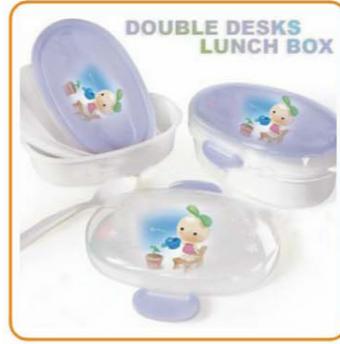
■ YWT-6437 名称: 双层饭盒 材料: 盖PS 身PP 尺寸: L187×W120×H72mm 箱规: 94×38×46cm