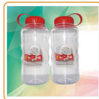
YWT-2820 材质:PE/AS 尺寸:9×22cm 容量:1000ml 装箱率:80pcs 箱规:74.5×47.5×44cm