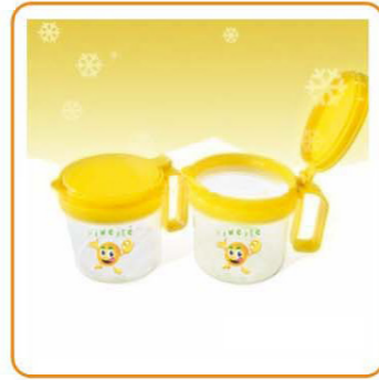
■ YWT-7306 名称: 多用果汁容器 尺寸: D120×H110mm 容量: 600ml 箱规: 77.5×54×73cm 毛重: 23.5kg 净重: 12.02kg