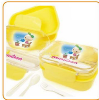
■ YWT-6442 名称: 饭盒 尺寸: L187×W145×H85mm 箱规: 59×46×59cm 毛重: 16.8kg 净重: 14.5kg