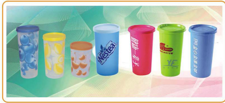
ARTNO.:YWT-2286S/M/L-1 Size:10.7×7.5cm/13.7×7.5cm/16.7×7.5cm Packing:0.119cbm/200pcs 0.124cbm/160pcs 0.111cbm/120pcs