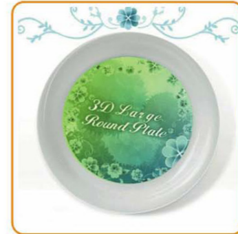
YWT-6502 名称: 3D圆形小号碟 尺寸: D209×H20mm 箱规: 240pcs