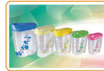
ART NO.:YWT-3935/3936/3937/3938/3939 5PCS STORAGE CONTAINER Size:9.5x5.1x13cm/10.8x6.2x14.3cm/12x7.1x16cm/ 13.3x8.1x17.8cm/14.8x9x19.7cm Packing:0.092cbm/36pcs