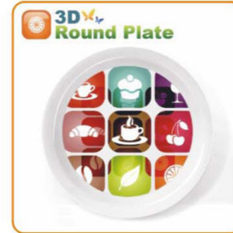
YWT-6501 名称: 单层饭盒 材质: 身: PP盖: PS 尺寸: L158×W105×G49mm 箱规: 65×52.5×43cm