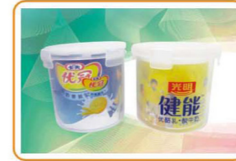
YWT-3947 名称: 储物盒