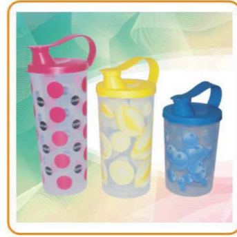
■ ARTNO.:YWT-2286S/M/L-2 Size:12.8×7.5cm/15.8×7.5cm/18.8×7.5cm Packing:0.104cbm/128pcs 0.094cbm/96pcs 0.101cbm/96pcs