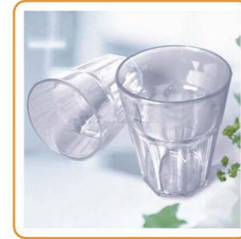
■ YWT-2016 名称: 水杯 尺寸: D90×H115mm 箱规: 48.5×37.5×47cm 毛重: 15.5kg 净重: 13.5kg