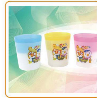
■ YWT-2371 名称: 杯子 尺寸: 9×10.3cm 体积: 0.104cbm 容量: 120pcs