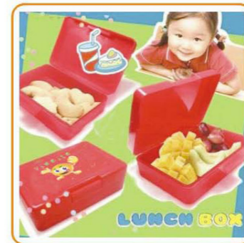
■ YWT-6460 名称: 饭盒 材质: 身PP 盖PS 尺寸: L158×W108×H50mm 箱规: 49×45×51cm