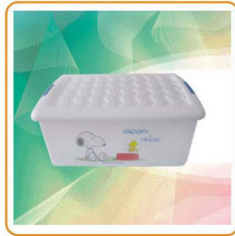
YWT-7611 名称: 卡通整理箱 尺寸: 59×39×23cm 容量: 6pcs/ctn 装箱率: 箱规: