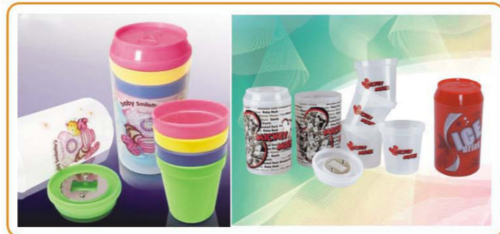
■ YWT-2349 名称: 杯子 尺寸: D71×H140mm 箱规: 61×38×43cm