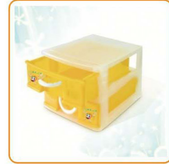
YWT-4200 名称: 储物盒 尺寸: L190×W130×H110mm 箱规: 58.5×45.5×56.5cm