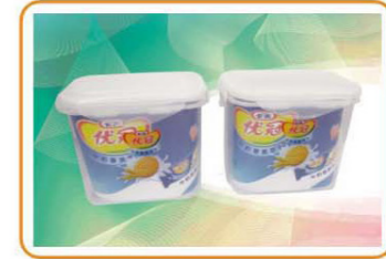
YWT-3948 名称: 储物盒