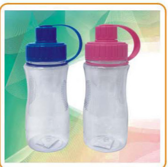
YWT-2496 材质:PP/AS 尺寸:7.5×22cm 容量:550ml 装箱率:80pcs 箱规:58×34×51.5cm