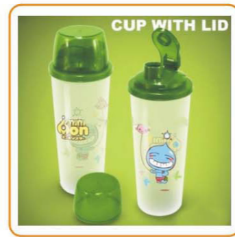
■ YWT-2548 名称: 水杯 尺寸: D74×H212mm 容量: 500ml 箱规: 58×37×65cm