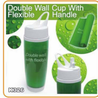
YWT-2859 名称: 双层水壶 尺寸: D70×H220mm 容量: 450ml 箱规: 66.3×53.6×25.8cm 毛重: 16.1kg 净重: 15.1kg