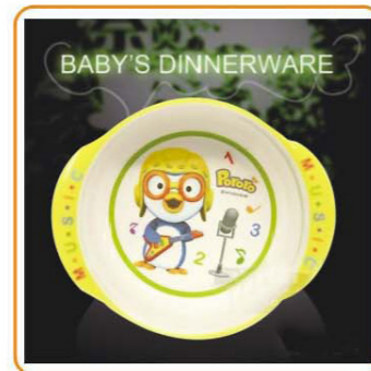
YWT-6504 名称: 儿童饭盒