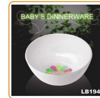
YWT-6508 名称: 儿童碗 尺寸: L112×W112×H55mm 箱规: 35×24×30cm 体积: 0.03cbm 毛重: 5kg 净重: 4kg