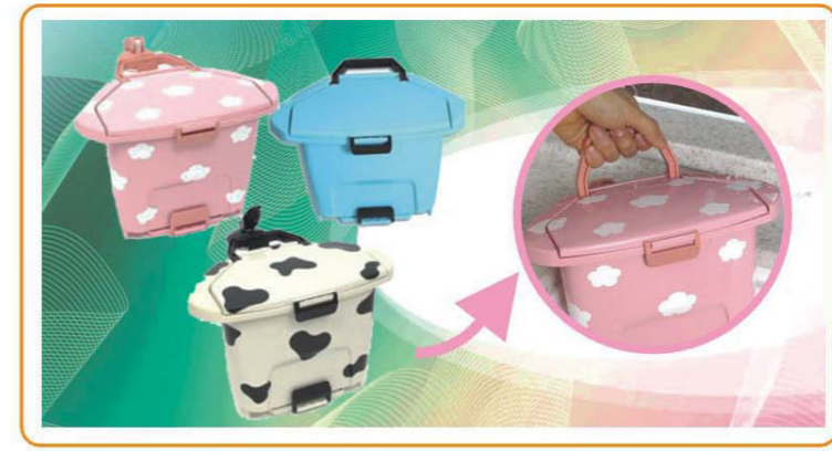
■ YWT-7546 名称: 垃圾桶