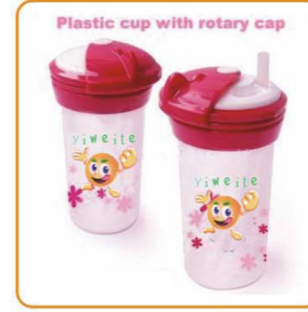
■ YWT-2546 名称: 旋盖杯子 尺寸: D60×H145mm 容量: 280ml 箱规: 64×41×48cm