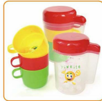
■ YWT-2538 名称: 杯子 尺寸: D72×H128mm 箱规: 50.5×48.5×55cm