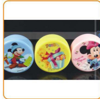
■ YWT-6449 名称: 饭盒