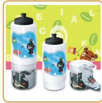
YWT-2858 名称: 运动水壶 尺寸: L61×W89×H245mm 容量: 750ml 箱规: 56×47×53cm 毛重: 10.5kg 净重: 9kg