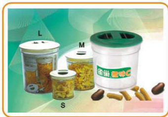
ART NO.:YWT-3962C AIR-TIGHT STORAGE CONTAINER SET Size:11x11.5cm(S)/14x16cm(M)/18.5x20cm(L) Packing:0.175cbm/24sets