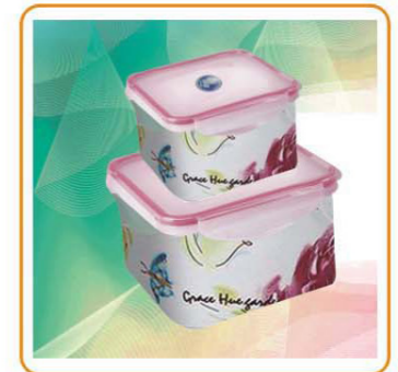
ART NO.:YWT-3968/3972 Material:PP Size:15×15×6cm Packing:0.14cbm/96pcs 0.19cbm/90pcs Unit Packing:Opp Bag