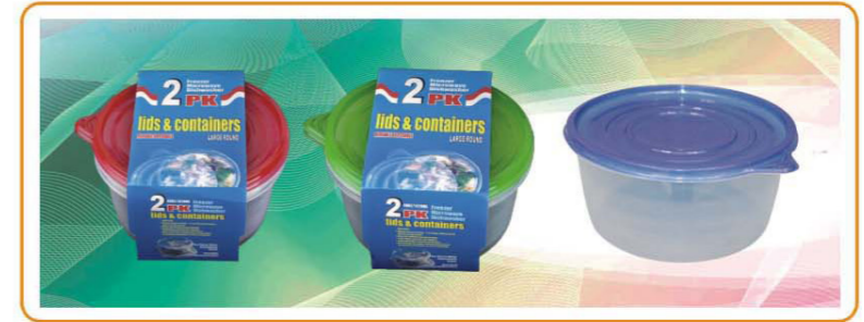
ARTNO.:YWT-4845-red cover/4845-green cover/4845-48oz