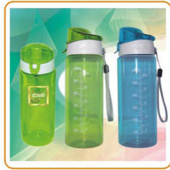
■ YWT-2817/2818 材质: PE/AS 容量: 600ml/800ml