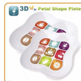
YWT-6503 名称: 3D花瓣形碟 尺寸: D200×H22mm 箱规: 42×22.5×20.5cm