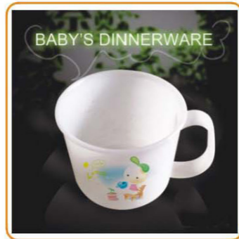
YWT-6512 名称: 儿童饭盒