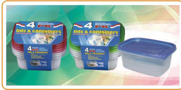
ARTNO.:YWT-1121-red cover/1121-green cover/1121-24oz