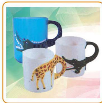
YWT-2277/2276 尺寸: 7.8×9.5cm/7.8×11.3cm 体积: 0.084cbm/0.082cbm 装箱率: 120pcs/210pcs