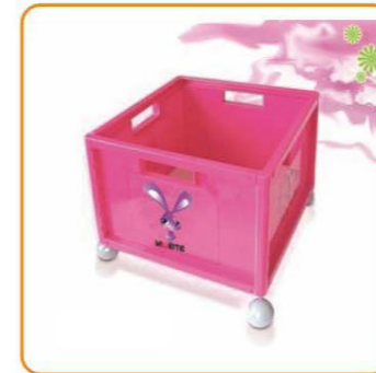
YWT-4100 名称: 储物盒 尺寸: L370×W370×H310mm 箱规: 63×51.5×75.8cm 毛重: 27.62kg 净重: 25.92kg