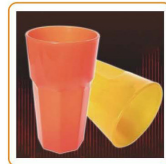
■ YWT-2102 名称: 杯子 尺寸: D90×H115mm 箱规: 57.5×36.5×46cm 容量: 400ml 毛重: 16.5kg 净重: 14.5kg