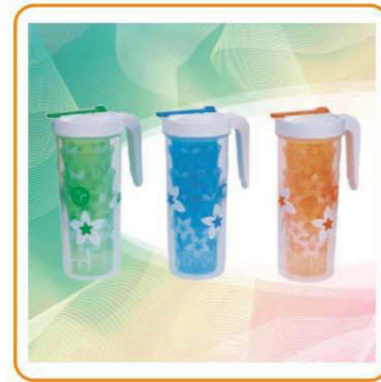
■ YWT-7005 名称: 水壶套组 容量: 1.8L 体积: 0.11cbm 装箱率: 36set