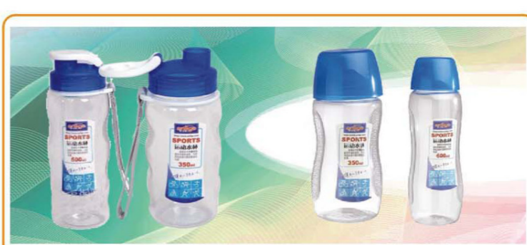
■ YWT-2734M/L YWT-2733M/L