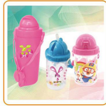
YWT-2864/2865 名称: 儿童水壶 尺寸: D73×H165mm/85×157mm 容量: 500ml/300ml 体积: 0.077cbm/