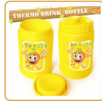
YWT-2544 名称: 杯子 尺寸: D92×H152mm 箱规: 46×55.2×45.6cm