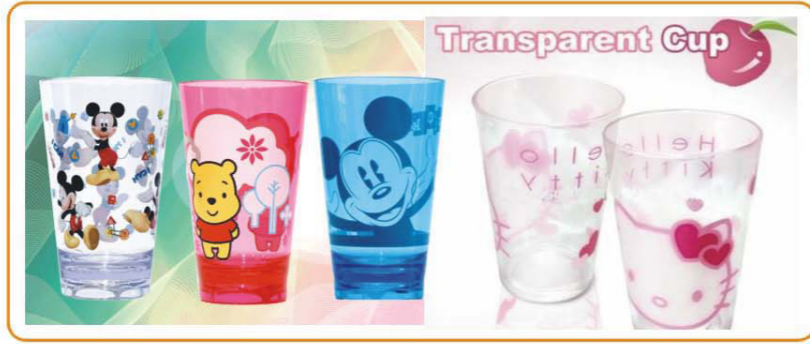
■ YWT-2379 名称: 水杯 尺寸: 6.5×10.5cm 体积: 0.078cbm 装箱率: 120pcs