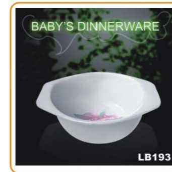
YWT-6507 名称: 儿童饭盒