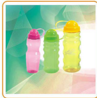
■ ART NO.:YWT-2720-A /2723-A/2724-A SPORTS BOTTLE Capacity:700ml/500ml/700ml Size: 24.5x8.3cm/20x7.5cm / 24.5x7.5cm Packing: 0.090cbm/48pcs / 0.098cbm/72pcs 0.111cbm/72pcs