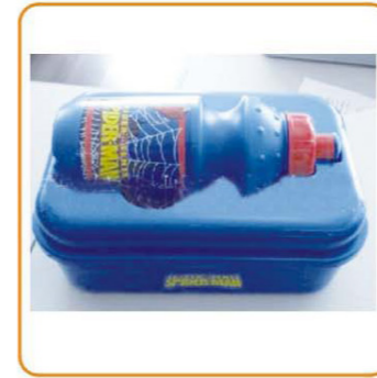
YWT-6461 名称: 运动水壶