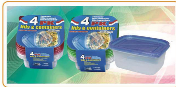
ARTNO.:YWT-1123-red cover/1123-green cover/1123-34oz