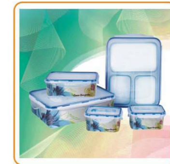
ART NO.:YWT-6329 Size:29.5x23x9cm/20.5x13.5x7cm/14x11x6.7cm Packing:0.144cbm/24pcs 0.109cbm/40pcs 0.14cbm/160pcs