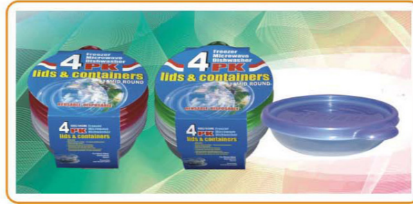
ARTNO.:YWT-1823-red cover/1823-green cover/1823-15oz