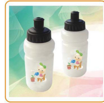
YWT-2860 名称: 运动水壶 材质: 盖PP 身PE 尺寸: D58×H150mm 容量: 300ml 箱规: 50.6×32×52.3cm