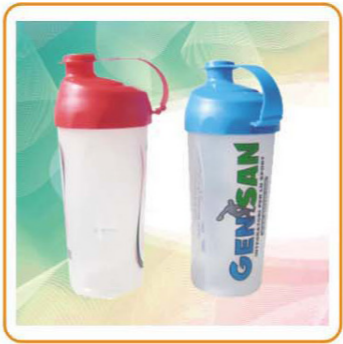
■ YWT-2474 容量: 500ml 体积: 0.1cbm 装箱率: 96pcs