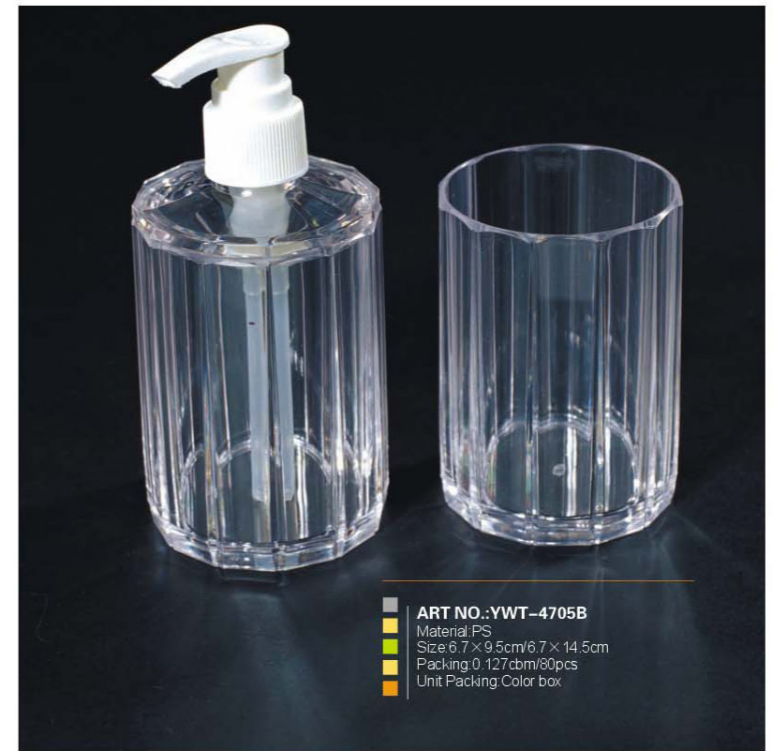
ART NO.:YWT-4705B Material:PS Size:6.7×9.5cm/6.7×14.5cm Packing:0.127cbm/80pcs Unit Packing:Color box