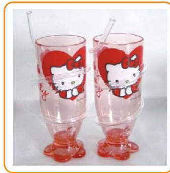
■ YWT-2537 名称: 杯子 尺寸: 5.5×14cm 体积: 0.063pcs 装箱率: 144pcs