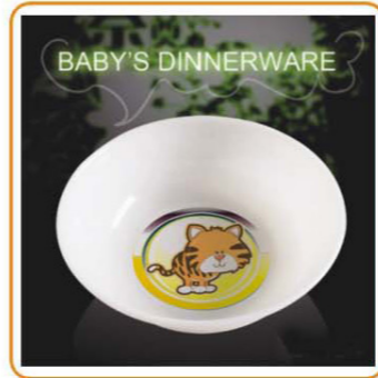
YWT-6511 名称: 儿童饭盒