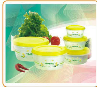
ART NO.:YWT-6322E 5PCS STORAGE CONTAINER Size:11.5x6cm/14.5x7cm/17.5x8.5cm/20x10.5cm/25.5 Packing:0.152cbm/30pcs