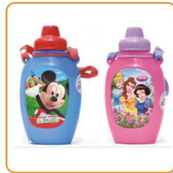
YWT-2621 容量: 420ml 装箱率: 96pcs 体积: 0.11cbm