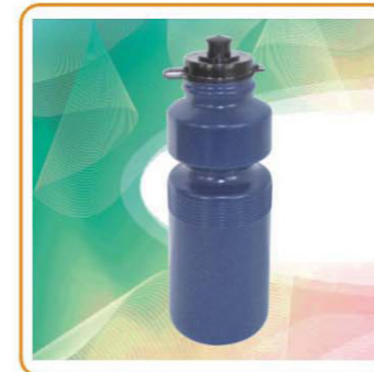
YWT-2597 材质:PE 尺寸:7×25cm 容量:750ml 装箱率:100pcs 箱规:72×37×52cm