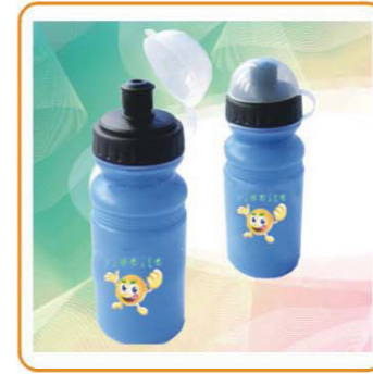
YWT-2861 名称: 运动水壶 材质: 盖PP 身: PE 尺寸: D59×H162mm 容量: 350ml 箱规: 61×30.5×51cm 毛重: 9.5kg