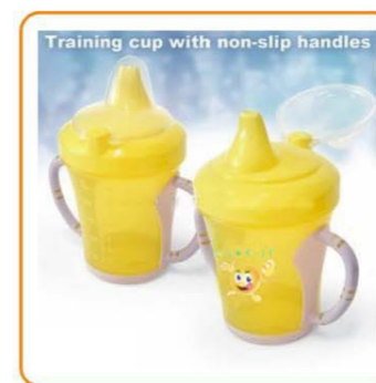
■ YWT-2574 名称: 带防滑手柄的幼儿杯 尺寸: D131×H149mm 箱规: 71.5×47×58.5cm 体积: 0.2cbm 毛重: 10kg 净重: 8.5kg