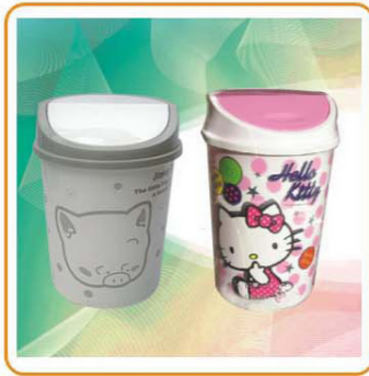
ART NO.:YWT-7502B DUSTBIN Size:29.3x30.3cm Packing:0.16cbm/24pcs