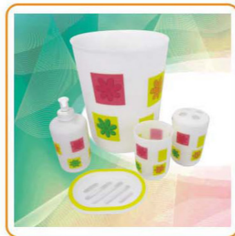
YWT-4701E 材质: PP 尺寸: 19.3×23.3cm 装箱率: 24套 箱规: 56.5×37.5×25.5cm