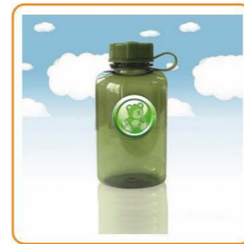
YWT-2863 名称: PC水壶 尺寸: D90×H188mm 容量: 800ml 箱规: 58×39×41.5cm 毛重: 8kg 净重: 6.5kg