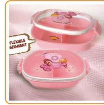
■ YWT-6432 名称: 单层饭盒 材质: 身PP 盖PS 尺寸: L158×W105×G49mm 箱规: 65×52.5×43cm