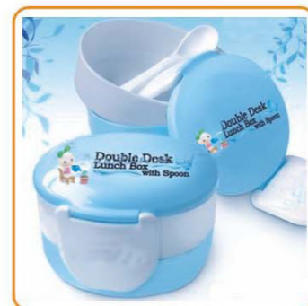
■ YWT-6444 名称: 双层饭盒 尺寸: L150×W130×H110mm 箱规: 54×47×68cm 体积: 0.173cbm 毛重: 13.2kg 净重: 11.7kg