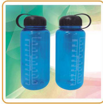
■ YWT-2819 材质: PE/AS 尺寸: 9×22cm 容量: 1000ml 装箱率: 48pcs 箱规: 60.5×31×50.5cm