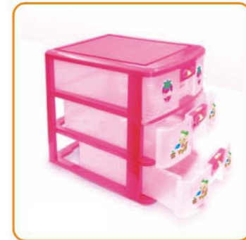
YWT-4202 名称: 储物盒 尺寸: L345×W255×H295mm 箱规: 78×36×60cm