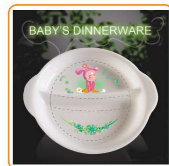
YWT-6506 名称: 儿童饭盒