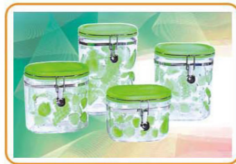
ART NO.:YWT-3958SG/3958MG/3958LG/3958XLG STORAGE CONTAINER Size:15.5x10x12cm(S)/15.5x10x15.5cm(M) 15.5x10x19.5cm(L)/15.5x10x23cm(XL) Packing:0.119cbm/36pcs(S) 0.157cbm/36pcs(M) 0.123cbm/24pcs(L) 0.143cbm/24pcs(XL)