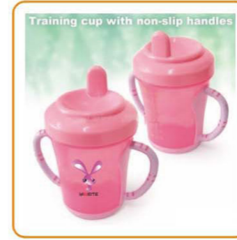
■ YWT-2575 名称: 带防滑手柄的幼儿杯 尺寸: D73×H112mm 箱规: 71.5×46×58.5cm 体积: 0.19cbm 毛重: 9.3kg 净重: 7.8kg