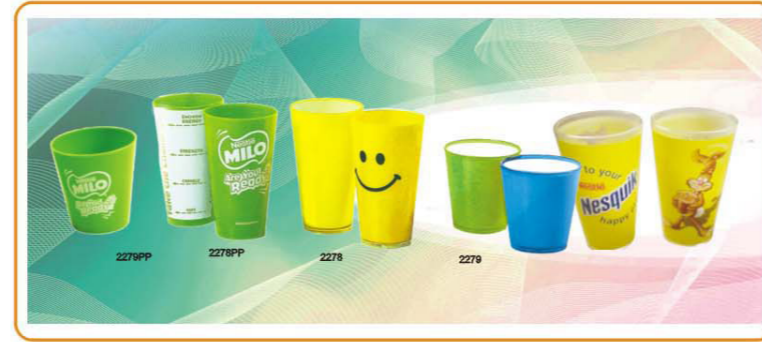
■ ART NO.:YWT-2279PP/2278PP/2278/2279 CUP 14oz 18oz 18oz 14oz Size:9.5x6.5x10cm / 9x15.8cm / 9x15.8cm / 9.5x6.5x10cm Packing:0.059cbm/288pcs 0.072cbm/240pcs 0.072cbm/240pcs 0.059cbm/288pcs