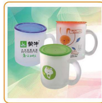
YWT-2321L-1 尺寸: 8.2×10cm 体积: 0.098 装箱率: 120pcs