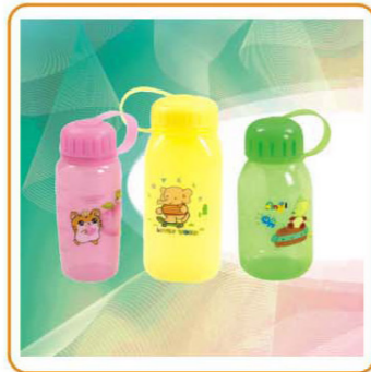
■ ART NO.:YWT-2729-A 2707-A 2717-A SPORTS BOTTLE Capacity:400ml 600ml 400ml Size:17x6.5cm 7.5x6x18cm 16.2x7.6cm Packing:0.073cbm/72pcs 0.087cbm/72pcs 0.078cbm/72pcs