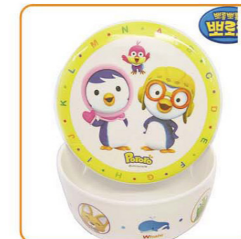
YWT-6450 名称: 饭盒