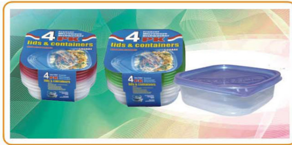
ARTNO.:YWT-2529-red cover/2529-green cover/2529-25oz