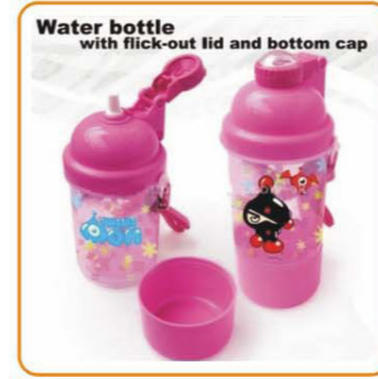
YWT-2875 名称: 带底盖的水壶 尺寸: D83×H205mm 容量: 380ml 箱规: 60.5×52×42cm