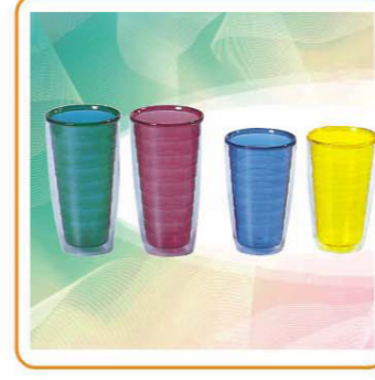
ART NO.:YWT-2282 YWT-2281 CUP Size:8.8x17cm 8.5x14cm Packing:0.098cbm/100pcs 0.088cbm/120pcs