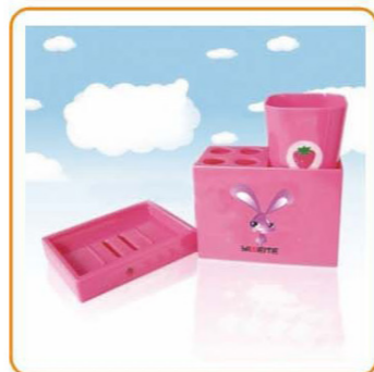
YWT-4715C 名称:浴室套装 尺寸:水杯: L65×W65×H90mm, 牙刷: L122×W60×H90mm, 皂盘: L120×W90×H20mm 包装: 96套 箱规: 60×50.5×58.2cm 毛重: 29.01kg 净重: 27.55kg