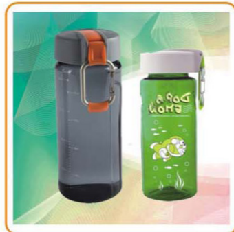
ART NO.:YWT-2816 Material:PC Size:19.5x7cm/23x7cm Packing:0.082cbm/72pcs 0.063cbm/48pcs Unit Packing:Opp Bag