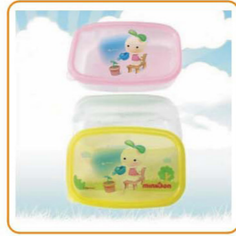
■ YWT-6435 名称: 饭盒 尺寸: L125×W87×H36mm