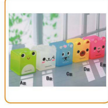
YWT-4421 名称: 纸巾盒