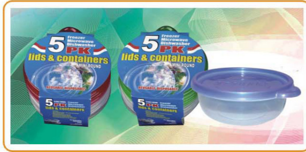
ARTNO.:YWT-1120-red cover/1120-green cover/1120-9.5oz