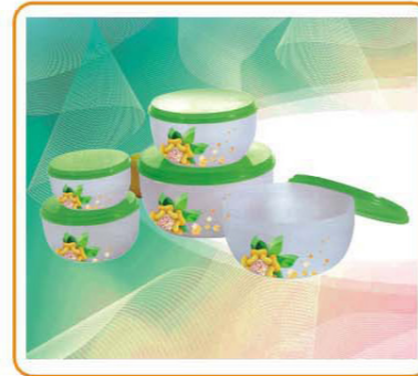
ART NO.:YWT-6330E 5PCS STORAGE CONTAINER SET Size:18x9.7cm/16.2x8.3cm/14.2x7.4cm 12.3x6.2cm/10.3x5.4cm Packing:0.117cbm/36pcs