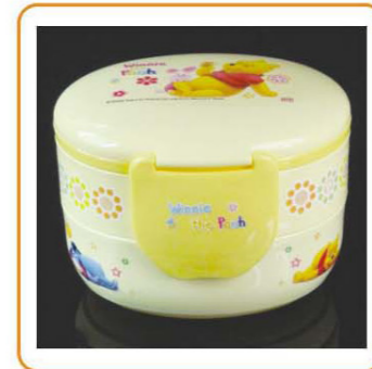
■ YWT-6446 名称: 饭盒