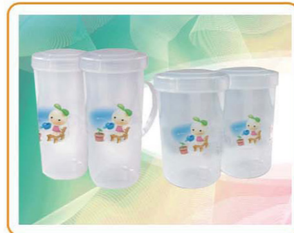
■ YWT-2534/2532 名称: 杯子 尺寸: D83×H187mm/172×136×90mm 箱规: 70×52×58.5cm 容量: 750ml 毛重: 23kg 净重: 18kg