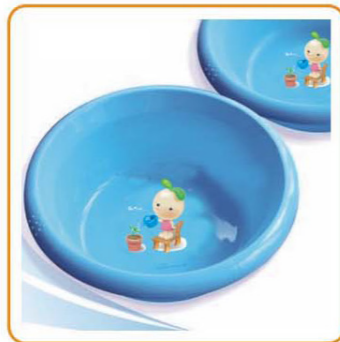
YWT-7226 名称:脸盆 尺寸: D260×H90mm