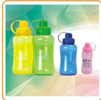
ART NO.:YWT-2715M/2716L-A/2714-A SPORTS BOTTLE Capacity:1000ml/800ml/600ml Size:25x9cm/23.5x9cm/21.5x7.5cm Packing:0.106cbm/48pcs 0.088cbm/48pcs 0.079cbm/72pcs