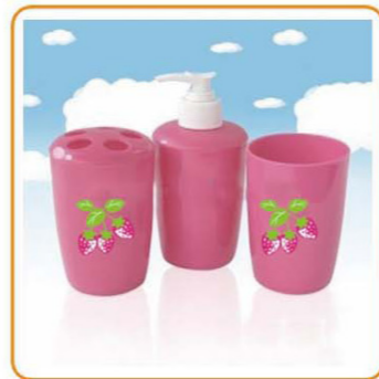
YWT-4701C 名称:浴室套装 尺寸:乳液罐: L73×W73×H150mm, 牙刷架: L73×W73×H110mm, 杯子: L73×W73×H100mm, 包装: 24套 箱规: 46.8×46.2×31.6cm 毛重: 5.2kg 净重: 3.5kg