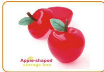
YWT-4004 名称: 苹果式储物盒 材料: PP 尺寸: 13×11.5cm 容量: 60pcs