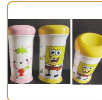
■ YWT-2612-3 名称: 水壶 体积: 0.83cbm 容量: 96pcs