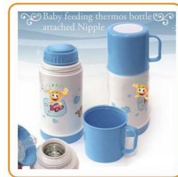
YWT-2873 名称: 保温奶瓶 尺寸: D80×H199mm 容量: 140ml 箱规: 56×54.5×44.5cm 体积: 0.136cbm 毛重: 20kg 净重: 18kg