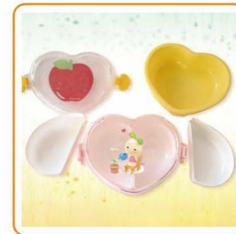
■ YWT-6459 名称: 饭盒 材质: 身PP 盖PS 尺寸: L137×W103×H48mm 箱规: 62×42.5×42cm