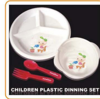
YWT-6505 名称: 儿童塑料餐具套装 尺寸: D230×H65mm 箱规: 46×39×39cm 毛重: 11.5kg 净重: 10kg