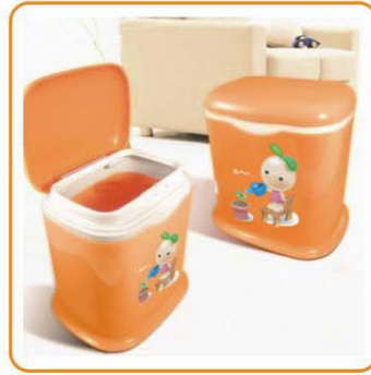
■ YWT-7517 名称: 台式杂物桶 尺寸: L177×W138×H174mm 箱规: 65.5×52×72cm 毛重: 18.5kg 净重: 17kg