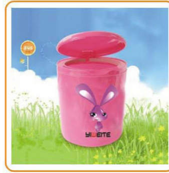
■ YWT-7542 名称: 垃圾桶 尺寸: D100×H110mm 箱规: 57×49×50cm 毛重: 14.8kg 净重: 12.6kg