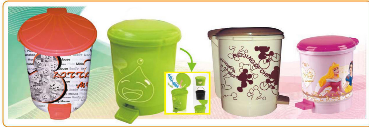
■ YWT-7551XL 名称: 垃圾桶 尺寸: 32×36.5cm 体积: 0.248cbm 容量: 6pcs