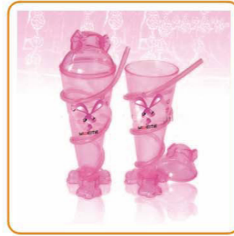
■ YWT-2536 名称: 杯子 材质: 身PS 吸管PS 尺寸: D70×H225mm 容量: 250ml 箱规: 49×25×56cm 毛重: 9kg 净重: 7kg