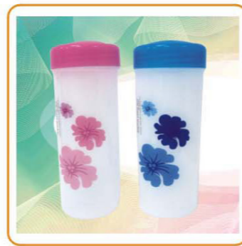
■ YWT-2639 材质: PP 尺寸: 7.5×17.5cm 容量: 450ml 装箱率: 144pcs 箱规: 57.5×43×54cm