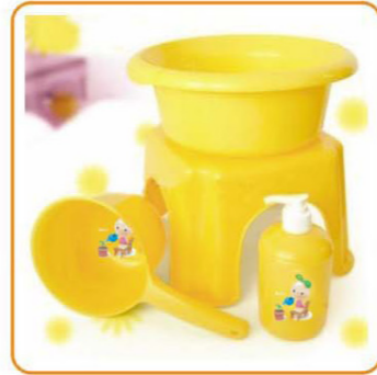
YWT-4714 名称:浴室套装 尺寸:水瓶L248×W134×H103mm, 凳子L214W211H148mm, 乳液罐: D71×H147mm, 脸盆: D260×H90mm 箱规: 75×51×62cm