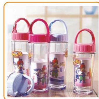
YWT-2821/2822 材质:PP/AS 尺寸:6×18.5cm 容量:350ml 装箱率:144pcs 箱规:51×49×58cm