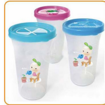
■ YWT-2539 名称: 杯子 尺寸: D80×H140mm 容量: 400ml 箱规: 60×30.5×73.5cm 毛重: 10.5kg 净重: 8.5kg