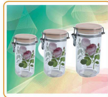
ART NO.:YWT-3961-SML STORAGE CONTAINER Size:11.8x12.5/11.8x17.5/11.8x21.5cm Packing:0.068cbm/60pcs 0.075cbm/60pcs 0.094cbm/48pcs