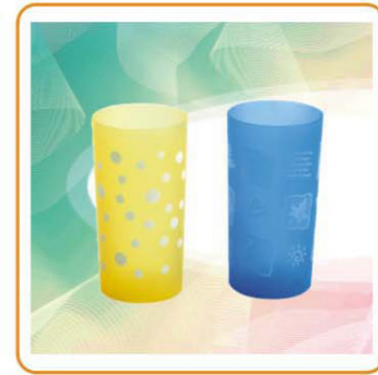
ART NO.:YWT-2286B / 2337 JUICE CUP 15oz Size:7x13.7cm / 8x5.5x13.5cm Packing:0.09cbm/336pcs 0.072cbm/240pcs