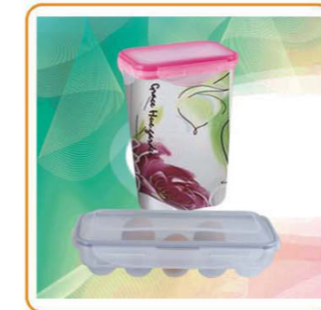
ART NO.:YWT-3967/6337 Material:PP Size:12.5×8.5×18.5cm/28×13×8cm Packing:0.13cbm/60pcs 0.12cbm/36pcs Unit Packing:Opp Bag