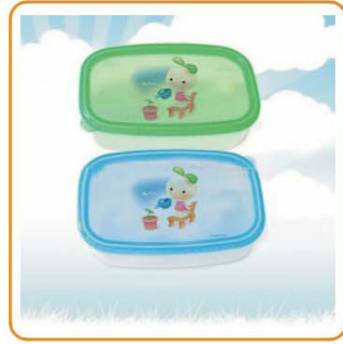
■ YWT-6434 名称: 饭盒 尺寸: L105×W75×H30mm