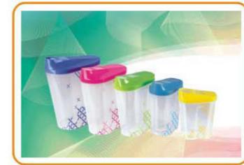
ART NO.:YWT-3939HPC Size:560ml/900ml/1250ml/1800ml/2500ml Packing:0.134cbm/24sets