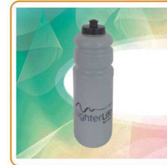
YWT-2596 材质:PE 尺寸:8.3×25.2cm 容量:1000ml 装箱率:100pcs 箱规:82×42×51cm