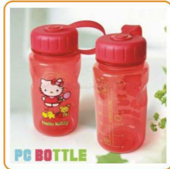
YWT-2884 名称:带冰冻棒的PC水壶 尺寸:6.7×162cm 体积:0.067cbm 容量:80pcs