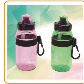
YWT-2883 名称: 水壶 尺寸: 7×17.5mm 容量: 450ml 材质: AS 箱规: 59×37.5×53.5cm 装箱率: 96pcs