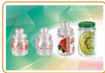
ART NO.:YWT-4066/YWT-4067/YWT-4070 Size:500ml/750ml/9x17.5cm Packing:0.087cbm/60pcs 0.11cbm/60pcs 0.075cbm/60pcs