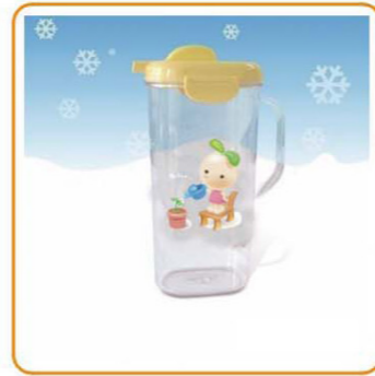
YWT-7003 名称: 多用水壶 尺寸: L138×W110×H282mm 容量: 1800ml 箱规: 60×40×53.5cm