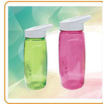
■ YWT-2838/2839 材质: PC 尺寸: 7×19.5cm/7×23cm 体积: 0.082cbm/0.063cbm 装箱率: 72/48pcs