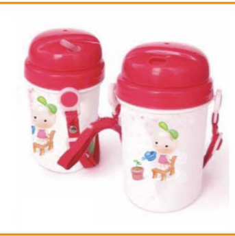
YWT-2867 名称: 儿童水壶 尺寸: D70×H137mm 容量: 400ml 箱规: 64.5×32×78cm 体积: 0.161cbm 毛重: 16.5kg 净重: 14kg