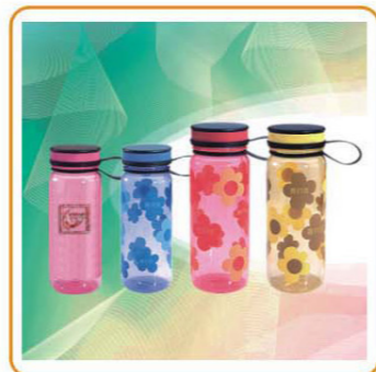
■ ART NO.:YWT-2846/2847 Material:PC Size:19.5x7cm/23x7cm Packing:0.082cbm/72pcs 0.063cbm/48pcs Unit Packing:Opp Bag