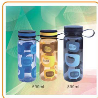
■ ART NO.:YWT-2840/2841 Material:PC Size:19.5x7cm/23x7cm Packing:0.082cbm/72pcs 0.063cbm/48pcs Unit Packing:Opp Bag