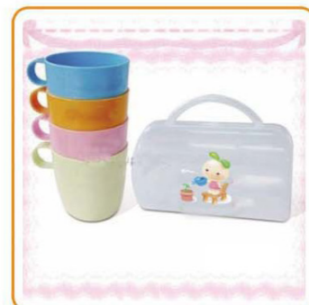
■ YWT-2533 名称: 杯子 尺寸: D83×H137mm 箱规: 70×52×58cm 毛重: 22kg 净重: 18.4kg