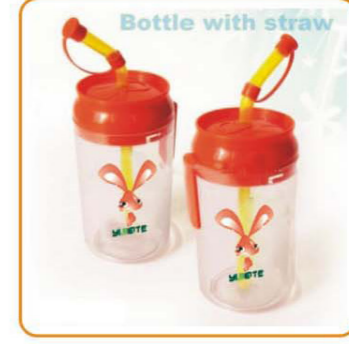
■ YWT-2540 名称: 杯子 材料: 盖子PP 身PS 尺寸: D73×H177mm 容量: 500ml 箱规: 45.8×38.5×72.8cm 毛重: 12kg 净重: 10kg