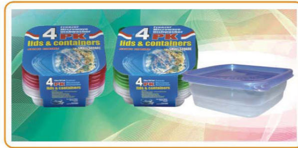
ARTNO.:YWT-2626-red cover/2626-green cover/2626-20oz