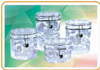
ART NO.:YWT-3958S/3958M/3958L/3958XL STORAGE CONTAINER Size:15.5x10x12cm(S)/15.5x10x15.5cm(M) 15.5x10x19.5cm(L)/15.5x10x23cm(XL) Packing:0.119cbm/36pcs(S) 0.157cbm/36pcs(M) 0.123cbm/24pcs(L) 0.143cbm/24pcs(XL)