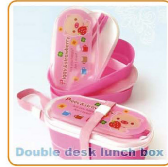
■ YWT-6438 名称: 双层饭盒 材质: 身PS 盖PP 尺寸: L170×W86×H85mm 箱规: 51×35.5×46cm 毛重: 11kg 净重: 9kg