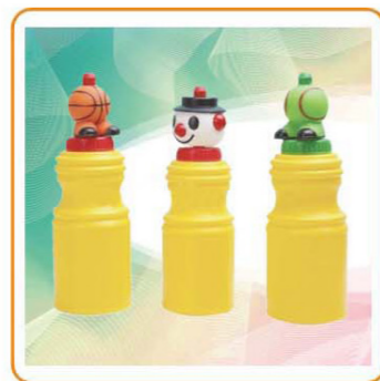
YWT-2648 名称: 水壶 尺寸: 8×23.5mm 容量: 630ml 材质: PE 箱规: 65.5×49.5×48.5cm 装箱率: 96pcs