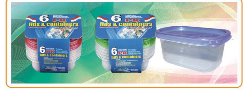
ARTNO.:YWT-9515-red cover/9515-green cover/9515-9.5oz