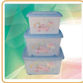
YWT-7614/7615 名称: 卡通整理箱 尺寸: 54×39×28cm/54×39×33cm 容量: 6pcs/ctn 装箱率: 箱规: