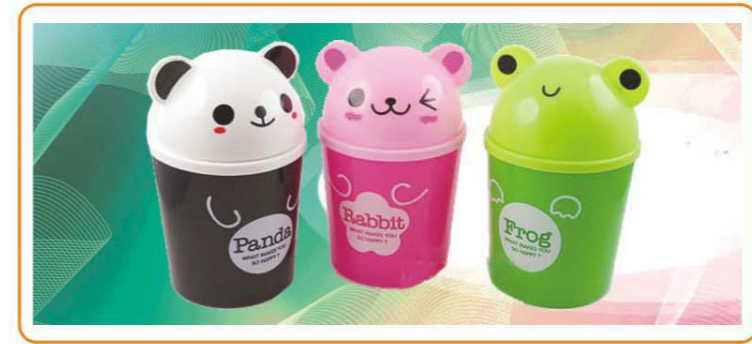
■ YWT-7545 名称: 垃圾桶