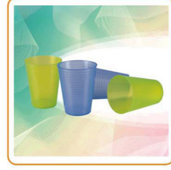
ARTNO.:YWT-2368 Size:8.2×10.4cm Packing:0.047cbm/6/480purchase