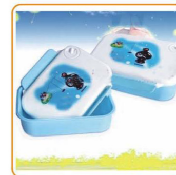
■ YWT-6443 名称: 饭盒 尺寸: L179×W133×H60mm 箱规: 55.5×42×50×cm