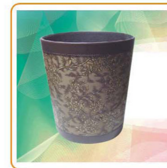
■ YWT-7547 名称: 垃圾桶