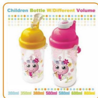
YWT-2881 名称: 儿童水壶 尺寸: D73×H220mm 容量: 600ml 箱规: 57×51×47cm