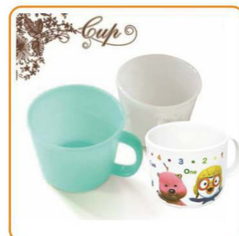
■ YWT-5275 名称: 杯子 尺寸: D81×H65mm 箱规: 64.5×48×45cm 毛重: 13.6kg 净重: 10.4kg