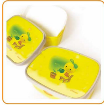
■ YWT-6439 名称: 饭盒 尺寸: L175×W130×H62mm 箱规: 59.5×41×50cm 体积: 0.111cbm 毛重: 14kg 净重: 12.5kg