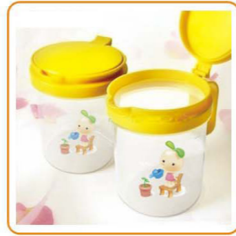
■ YWT-7307 名称: 多用果汁容器 尺寸: D120×H145mm 容量: 900ml 箱规: 78.5×63×65cm 毛重: 26.2kg 净重: 19.05kg