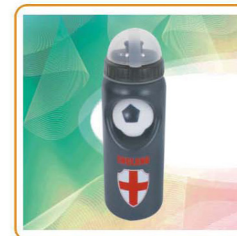
YWT-2598 材质:PE 尺寸:7.2×23.5cm 容量:700ml 装箱率:100pcs 箱规:73.5×37×50cm