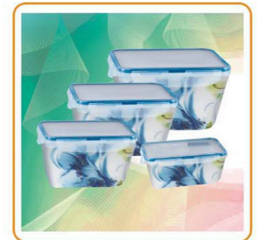
ART NO.:YWT-3966/3969/3970/3971 Material:PP Size:12.5×8.5×5.5cm/20×13×9cm /20×13×12cm/20×13×5.5cm Packing:0.093cbm/144pcs 0.15cbm/60pcs 0.16cbm/48pcs 0.14cbm/90pcs Unit Packing:Opp Bag