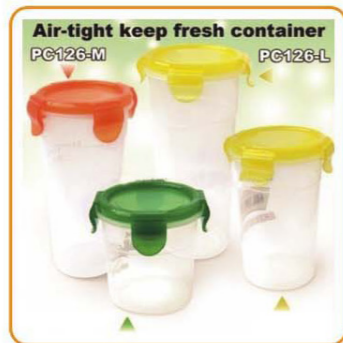
Air-tight keep fresh container PC126-M PC126-L